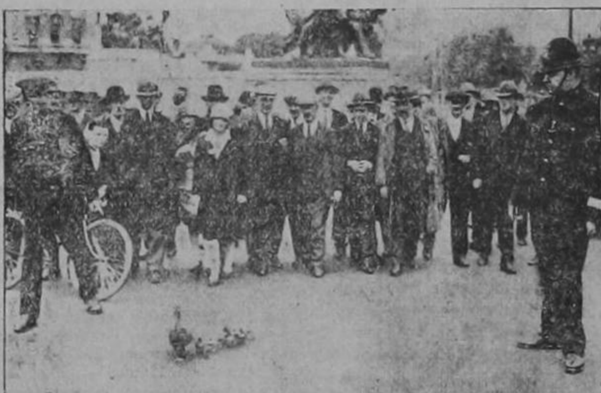
En Londres, frente al Palacio de Buckingham, residencia de los reyes de Inglaterra, hubó de ser suspendido el tráfico en medio de la curiosidad de los transeuntes, mientras atravesaba la calle una pata que acompañada de sus patitos iba a hacerle una visita al Rey. En la foto se ve la pata donde va majestuosamente hacia el Parque Saint James para de allí pasar a los patios del Real Palacio.